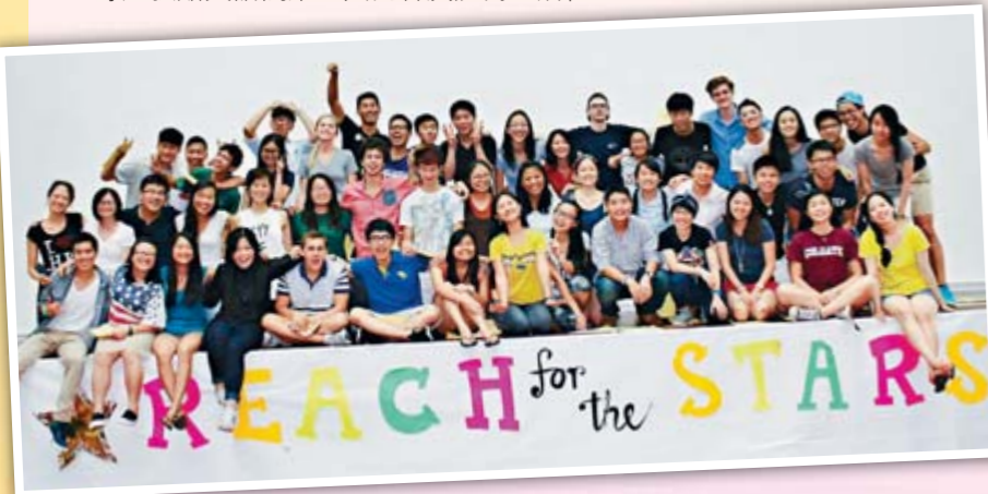
▲透過參加暑期的「夏橋計劃」，學生的英語能力都大有進步！

佛教大雄中學重視英語教學，除了增撥資源於所有班級實施分組教學外，更積極營造良好的英語環境，讓學生在校園生活中活用英語。除教育局規定的外籍老師名額外，學校更自資增聘多一名外籍老師，協助舉辦更豐富的英語活動，以有效地提升學生英語效能。此外，學校的英語活動豐富而全面，包括安排學生於早讀時段閱讀英文文章、安排學生於妙真花園進行英文新聞演說比賽及英語朗讀等，並於校園內定期按專題張貼英語詞彙，其內容廣泛而生活化。