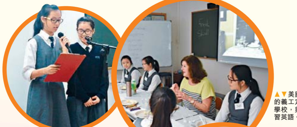
▲▼美國婦女會的義工定期到訪學校，與學生練習英語。