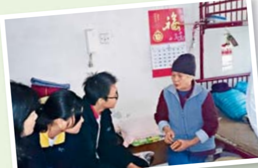
▲學生細心聆聽獨居長者傾訴心事。

學校安排學生參加由覺醒心靈成長中心主辦、香港佛教聯合會、佛教正行長者鄰舍中心合辦的「相愛無親疏」之家居探訪計劃，讓學生從探訪長者家居生活中學習關懷別人，並長養慈悲心，從關懷探訪的長者聯想到家中的長輩，珍惜與家人共聚天倫的時光。